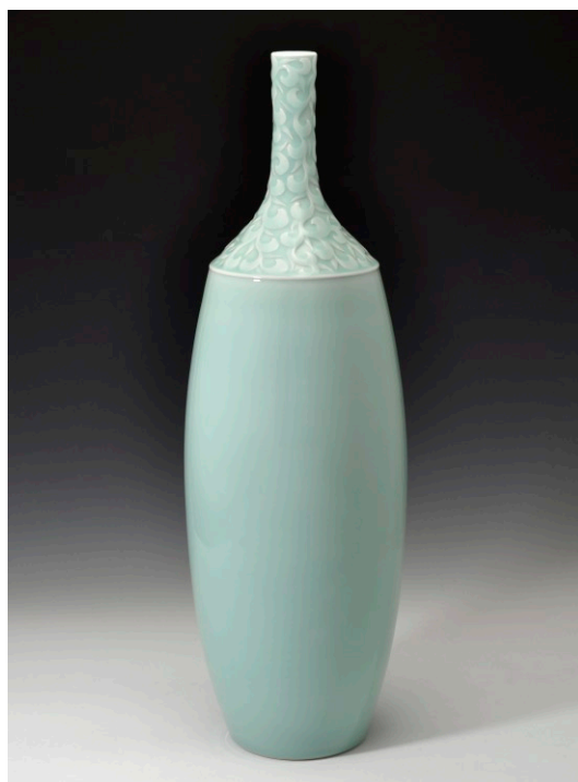
Chen Shanlin „Jin shang tian hua – Auf Brokat noch Blumen sticken“ Modernes zartblaues ( fenqing ) Seladon mit prächtigem Blütendekor