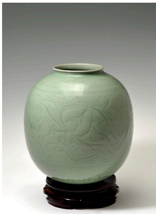
Chen Shaoqing „Kugelvase mit geschnittenen Blüten“