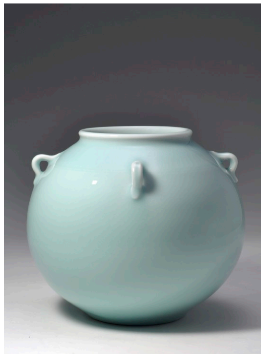
Mao Weijie „Glück in allen 4 Richtungen“ Zartblaue ( fenqing ) Kugelvase mit vier Ösen