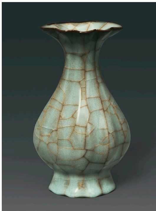
Mao Zhengcong Gold- und Silberfaden-Craqueles auf traditioneller Gefäßform ( baicai ping - Flasche in Form des chinesischen Blätterkohls)